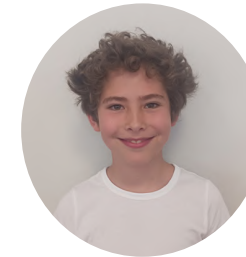
PALAZZO Antoine 07/03/2014 10 ans